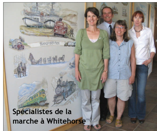
Spécialistes de la marche à Whitehorse

Le printemps dernier, dans la foulée du succès du Canadian Walkability Roadshow 2007, nous avons visité quatre collectivités canadiennes : Hamilton (Ontario), Moncton (N.-B.), Kelowna (C.-B.) et Whitehorse (Yukon), avec une escale à Vancouver pour participer à une série d'exposés de l'Université Simon Fraser, intitulée Shifting Gears , y compris la présentation Walking Around the World et un atelier professionnel d'une journée.