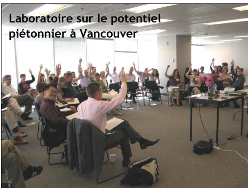
Laboratoire sur le potentiel piétonnier à Vancouver

Le Laboratoire canadien sur le potentiel piétonnier a reçu un financement du programme Sur la route du transport durable (SRTD) de Transport Canada ( http://www.tc.gc.ca/medias/communiques/nat/2008/08-h246f.htm ), ainsi que des collectivités participantes.