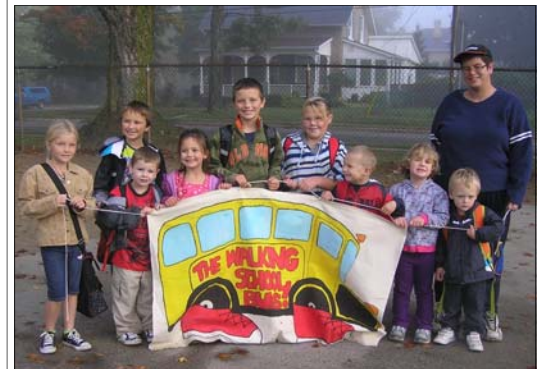
Pédibus de l'école publique McGregor, à Aylmer (Ontario)

La ville d'Aylmer a pris à coeur le défi « Je vais à l'école À PIED... et toi ? ».