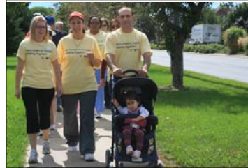
Membres du programme Newcomers to Canada Walk Together

Ils ont ensuite montré leur soutien en signant la promesse « Je vais à l'école À PIED... et toi ? ».