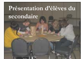
Présentation d'élèves du secondaire