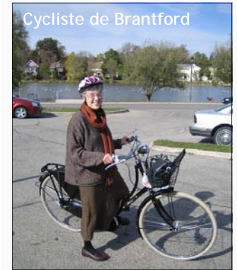
Cycliste de Brantford