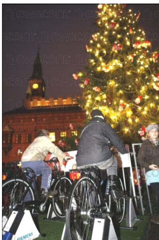
L'arbre de Noël « durable » de l'hôtel de ville de Copenhague : ses lumières marchent uniquement à pédales !

Restez à l'écoute ! Nous continuerons à suivre les progrès de la Première nation M'Chigeeng.