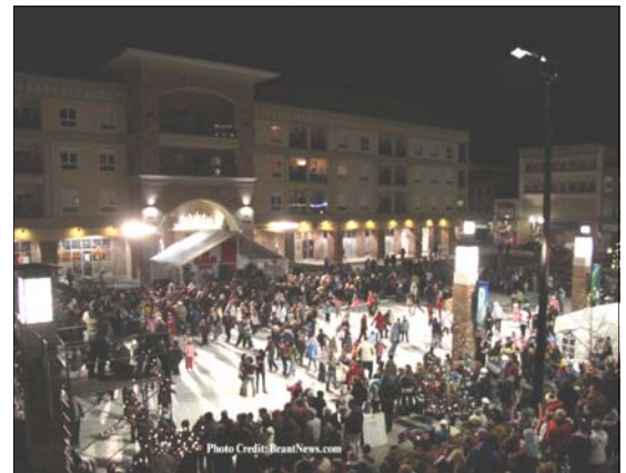
Harmony Square, centre-ville de Brantford : en combinant sa fierté civique et son esprit des Jeux olympiques, Brantford a trouvé la recette parfaite pour célébrer la revitalisation de son centre-ville.

L'école publique Montgomery , gagnante d'un prix du relais de la flamme olympique, est l'une de seulement huit écoles canadiennes à se voir décerner ce prix prestigieux ! Pour sa présentation au concours, l'école Montgomery s'est basée sur son programme EAS (Écoliers actifs et en sécurité). Le 5 novembre, Mark Boswell, athlète canadien olympique de piste, s'est joint à l'assemblée de l'école pour la cérémonie officielle de remise du prix.