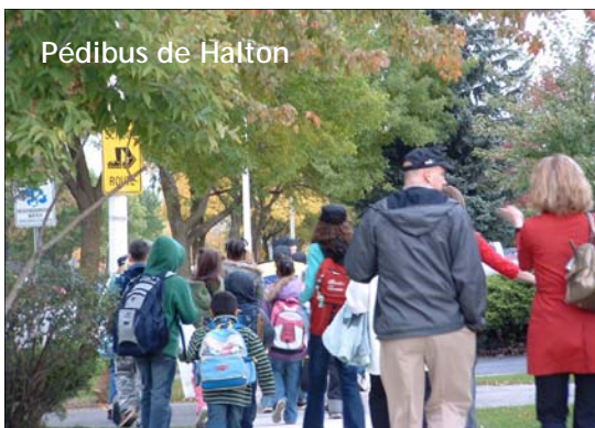
Pédibus de Halton

Le Conseil de sécurité d'Ottawa , ( www.ottawasafetycouncil.ca , site bilingue en chantier), organisme qui travaille étroitement avec le programme EAS local, offre aux écoles des présentations sur la marche sécuritaire. À l'occasion de la JIME 2009, à l'école publique Churchill Alternative, cinq Pédibus « transportant » 45 « passagers » (un nouveau record pour l'école) et 70% des élèves de l'école se sont déplacés à pied ou en vélo, sur une partie ou la totalité du trajet maison-école, soit une augmentation de 38% par rapport aux jours précédant la JIME. Les efforts de l'école lui ont valu une couverture médiatique à la chaîne CTV Ottawa, au poste CBC et dans le journal Ottawa Sun .